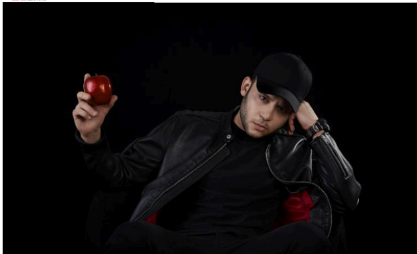
Sanremo: Racore, La Rappresentate di Lista e Canova per gli showcase di Radio2

06-02 23:10 PRESCRIZIONE: BOTTA E RISPOSTA MORANI-NOBILI, DEM 'USCITE DA MAG