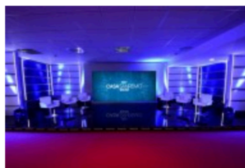
Teatro Casa Sanremo

Casa Sanremo creata ideata e realizzata 13 anni fa dal Consorzio Gruppo Eventi, arriva a una data importante della sua storia, firmando una partnership con RAI e diventando ufficialmente “La Casa del Festival”.