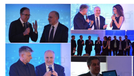
#Festival2019: con la

Prova ora Babel Imparare una lingua studiando 15 minuti al giorno è facile... se sai come farlo!