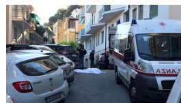
Sanremo: dramma in