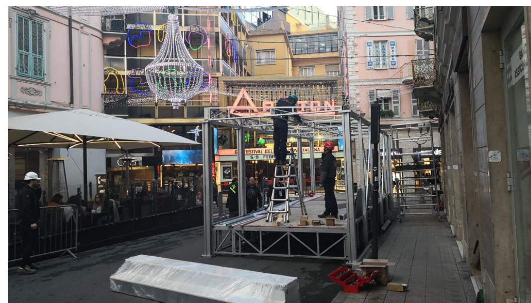
La “teca” davanti all'Ariston

Torna Favino, sorge la “teca” sul red carpet. La città sempre più in clima Festival