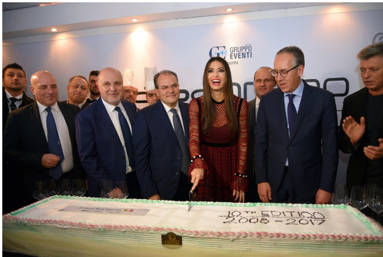
Elisabetta Gregoraci taglio della torta