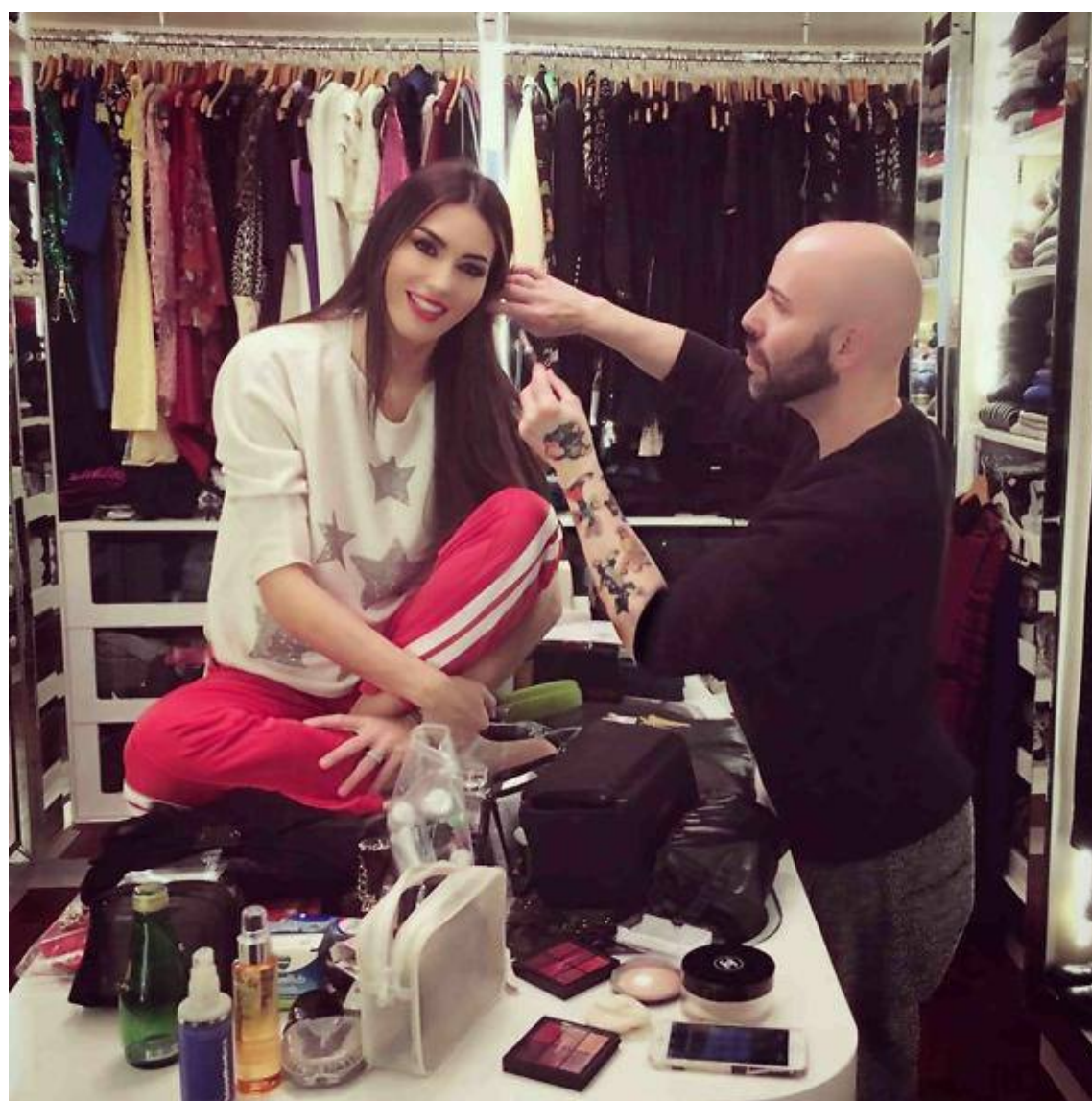
Elisabetta Gregoraci al trucco e parrucco prima del taglio del nastro al Palafiori

Elisabetta Gregoraci ha dato il via alla maratona sanremese tagliando il nastro di apertura di Casa Sanremo sfoggiando un grande sorriso e un look impeccabile. Pochissime ore prima la presentatrice era alle prese con trucco e parrucco nei camerini e attraverso il suo profilo Instagram ci ha regalato un piccolo anticipo del suo look.