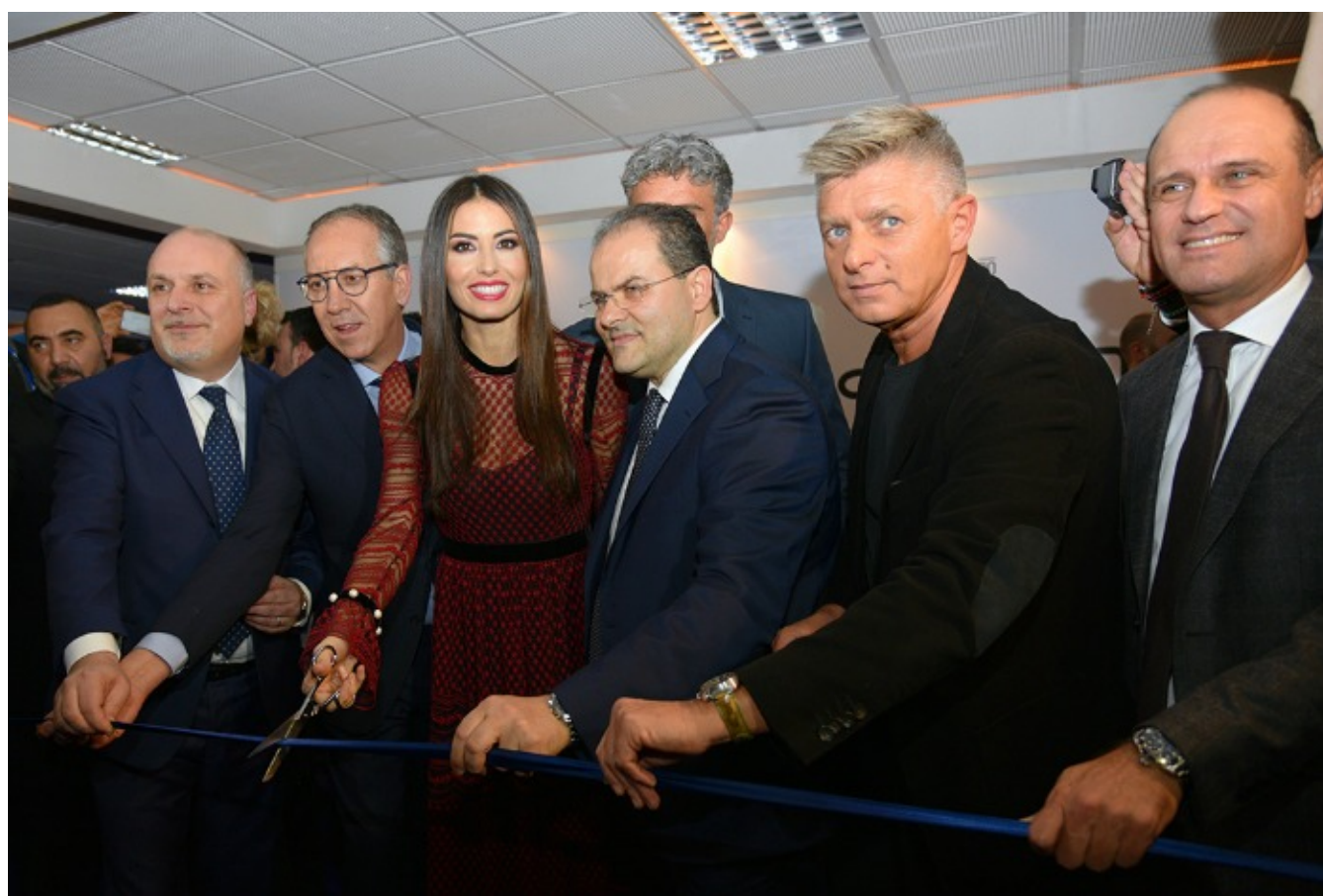
Elisabetta Gregoraci taglio del nastro

Elisabetta Gregoraci news: la showgirl regina della serata di apertura di Casa Sanremo 2017