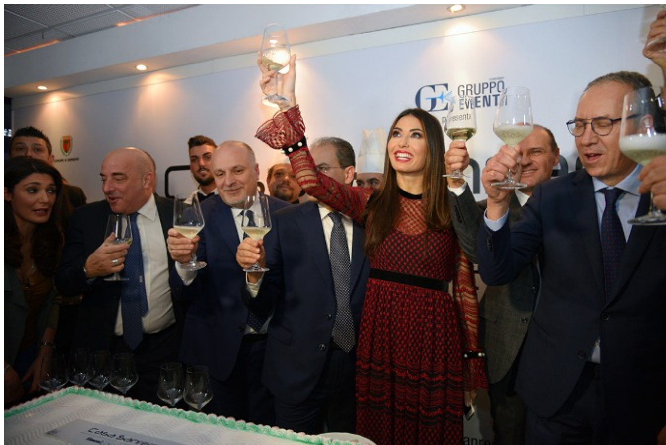
Elisabetta Gregoraci brindisi finale Casa Sanremo 2017

La showgirl e conduttrice televisiva si è presentata ai giornalisti e fotografi con grande stile. Senza mai perdere il sorriso e il suo animo stravagante. Per l'inaugurazione di Casa Sanremo ha scelto un abito lungo, con molte trasparenze e ricami firmato Alberta Ferretti.